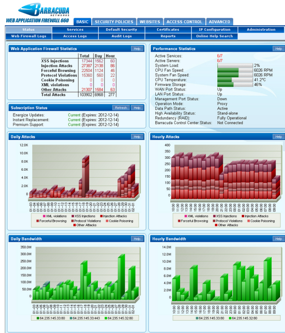
Die Barracuda Web Application Firewall überwacht und zeichnet gängige Applikations-Angriffe, Leistungsstatistiken und Bandbreitennutzung auf.

Um den Administrationsaufwand zu minimieren, der beim Schutz von Websites vor Anwendungsschwachstellen entsteht, empfängt die Barracuda Web Application Firewall automatisch Energize Updates mit den neuesten Richtlinien-, Sicherheits- und Angriffsdefinitionen. Neben den umfassenden Sicherheitsvorteilen gibt es zudem Funktionen für die Anwendungsbereitstellung, wie z. B. SSL-Offloading, SSL-Acceleration und Load Balancing. Mit diesen Funktionen können Sie die Leistung, Skalierbarkeit und den Verwaltungsaufwand für die heutigen äußerst anspruchsvollen Datacenter-Infrastrukturen optimieren.