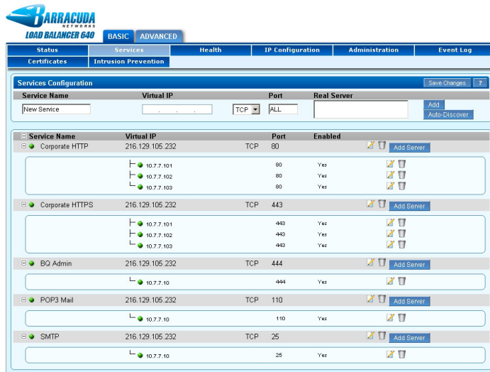
Der Barracuda Load Balancer verteilt Datenverkehr für mehrere Server, inklusive Web-, E-Mail- und sonstige Netzwerkanwendungen.

Der im Barracuda Load Balancer integrierte Service Monitor stellt sicher, dass Server und deren zugeordnete Anwendungen stets betriebsbereit sind. Bei einem Server- oder Anwendungsausfall nutzt der Barracuda Load Balancer ein automatisches Failover unter den Servern, um eine unterbrechungsfreie Verfügbarkeit sicherzustellen. Um die Risiken zu minimieren, die mit dem Ausfall des Load Balancer selbst verbunden sind, können zwei Barracuda Load Balancer in einer Aktiv-/Passiv-Konfiguration bereitgestellt werden.